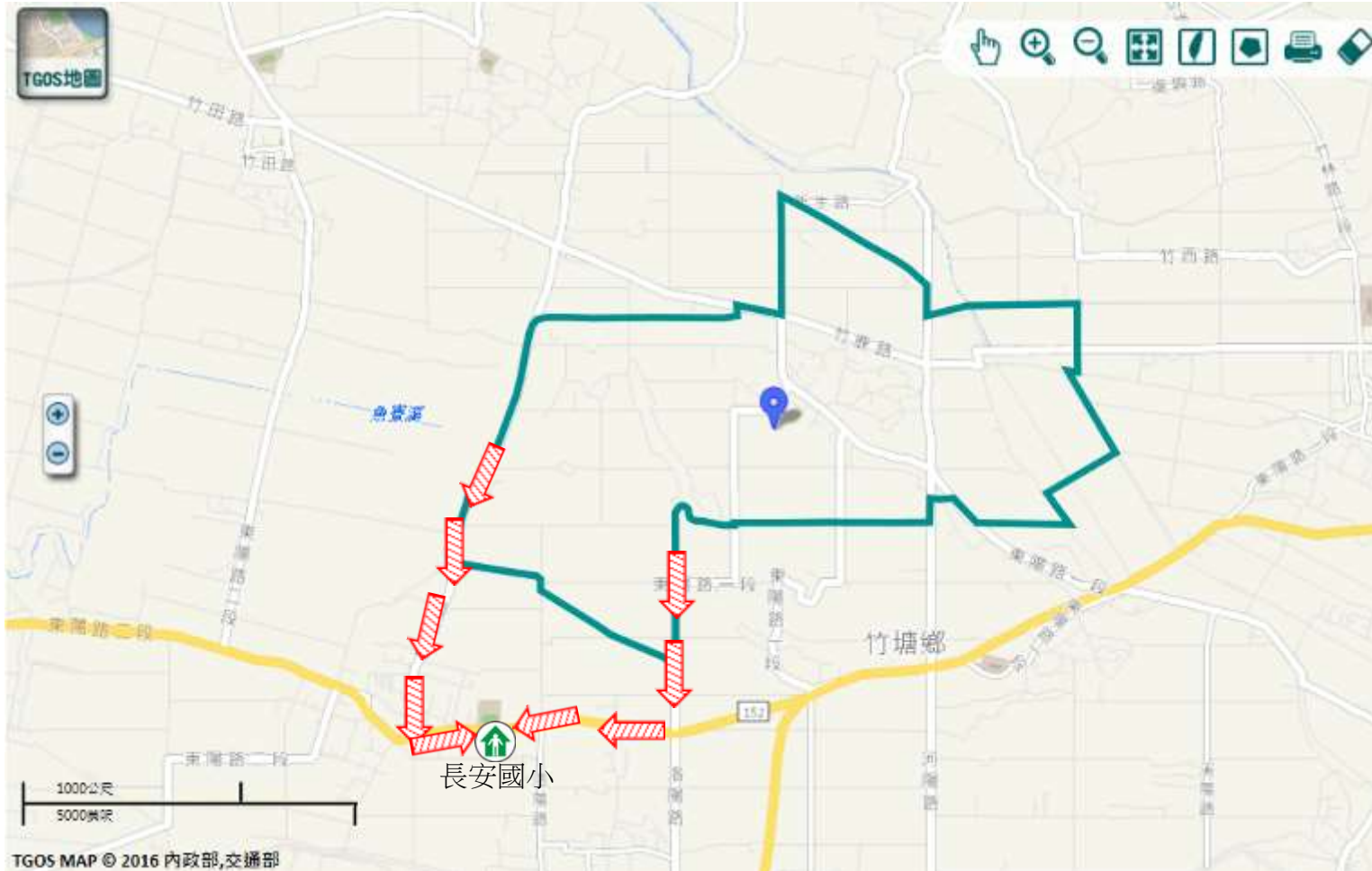
TGOS MAP © 2016 內政部,交通部